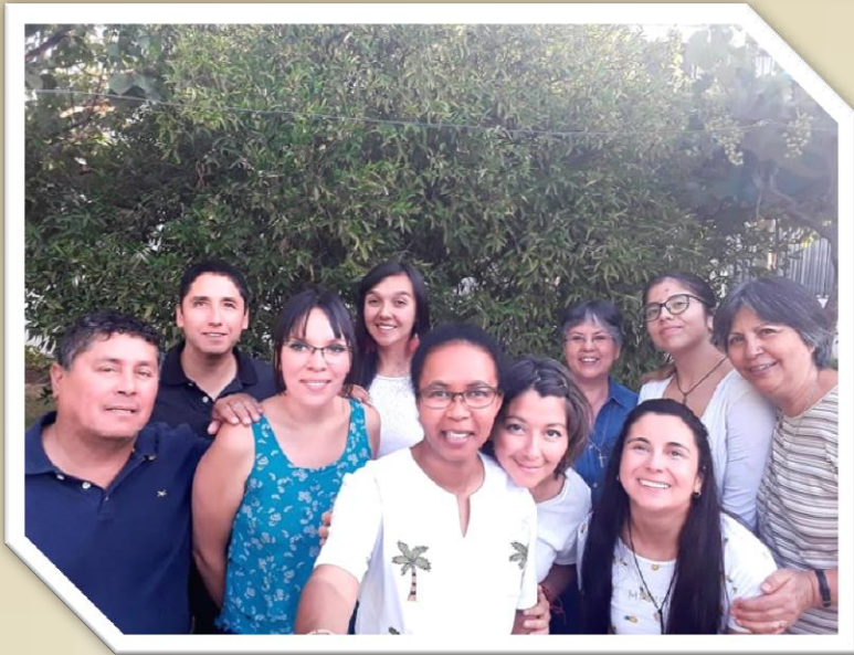
Miaraka tamin'i masera Emma